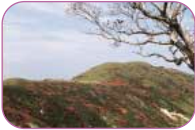
■ドウダンツツジの紅葉(萩原町コース)

山腹まではやや急峻な登りだが、山頂付近は緩やかな稜線。山頂近くにはドウダンツツジの群生があり、山頂からは360度の大自然が楽しめる。