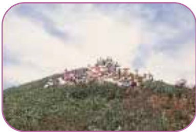
■川上岳登山(馬瀬村コース) 馬瀬村からの登山は、毎年10月初旬に開催される登山会に参加されるのがお勧めで、山頂付近の紅葉美が楽しめます。

■「宮の大イチイ」と原生林 (宮村コース) 林道から道標にしたがってツメタ谷を渡ると、そこが「宮木曾ヒノキ林木遺伝資源保存林」です。樹齢200年以上のヒノキ、サワラ、ヒメコマツ、ブナなどの巨木林が約9ヘクタール広がっています。林内には、林野庁が「森の巨人たち百選」に選んだ樹齢二千年の「宮の大イチイ」が生育しています。