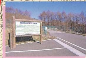
葛尾登山口 4.0km 80分