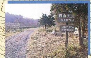
岩下登山口 4.0km 90分