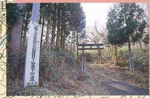
下田代登山口 1.7km 50分