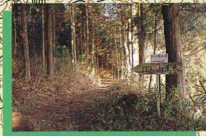
移登山口 3.9km 60分