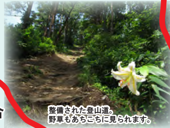
整備された登山道。野草もあちこちに見られます。