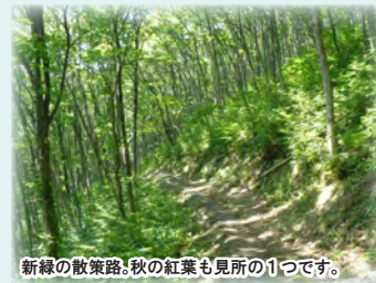
新緑の散策路!秋の紅葉も見所の1つです。