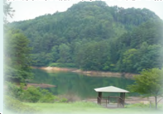
夏の貯水池。小動物や野鳥にとっても憩いの場。