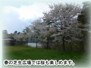
春の芝生広場では桜も楽しめます。