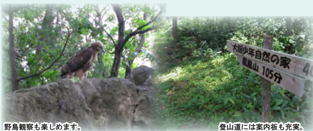
野鳥観察も楽しめます。